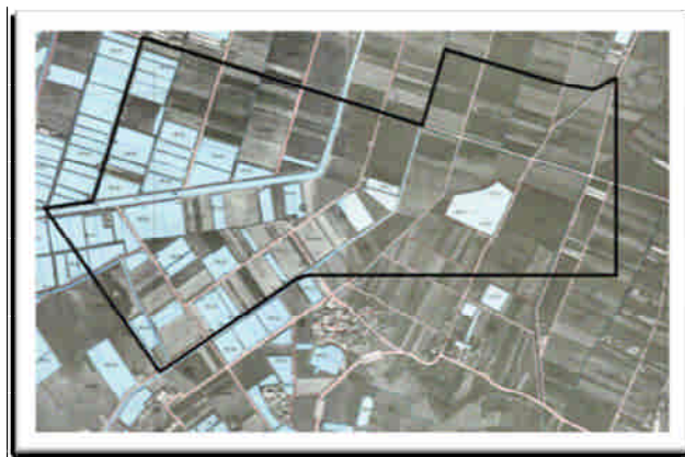
圖二、1998 年高雄大學預定地之空照圖

在設校之前，高雄大學校地其實是一片魚塢地、農地、旱地交織而成的農業區塊(圖二)，在 2000 年開始招生時，全校僅有一棟綜合大樓，容納約 300 名來自六個系所的新生及行政人員。在這樣相對「艱困」的環境下，卻提供了日後發展基督徒教師與學生每週定期聚餐互動的有利條件。