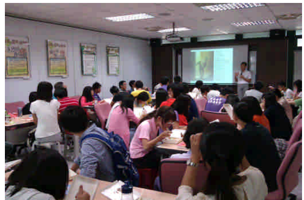
圖三、愛筵社聚會之情形

到目前為止，愛筵社每次聚集人數在 40-50 人之間（桌長以及學生），此模式運作順利要歸功於每一個服事人員的貢獻，包括事先聚會訊息的寄發及便當需求統計；便當費用無私的奉獻（由光鹽社與參與之教會的財務支援）；桌長犧牲午休的時間奉獻，還有學生基督徒社團與教會之跟進(請參考文末之圖四)。